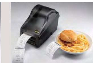
> OS系列搭配開刀半切功能