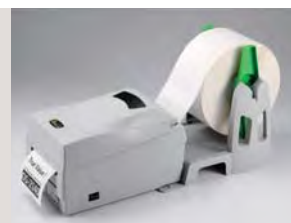
> 搭配外掛紙架可掛8吋外徑紙捲